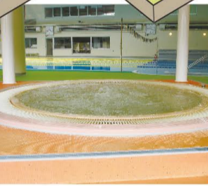
④ジャグジープール プールに入られた後は、ジャグジー・採暖室で暖まっていただけます。 ※ジャグジー・採暖室はプールご利用の方のみ使用していただけます