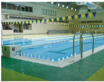
①競泳用プール (25m×6コース) 屋内温水 目的に応じて使用して頂ける全6コース。ロングスイムコースやウォーキングコースなど様々な目的に応じてご利用頂けます。