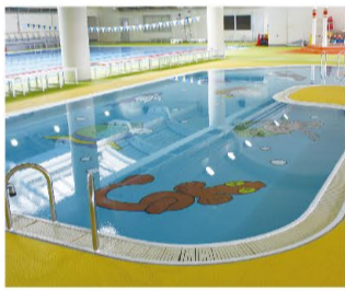
②幼児用プール 屋内温水 水深50cmで水慣れに最適です。 ※小さなお子様には保護者の方も、一緒にご利用下さい