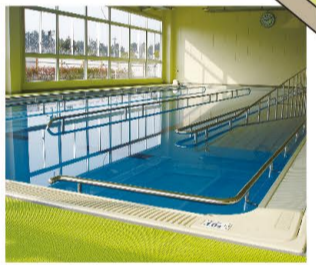
③歩行用プール (15m×3コース+スロープ) 屋内温水 様々な方にご利用頂きやすい水深となっております。また、左右に手すりもついております。リハビリからシェイプアップ目的の方までどなたでも水中運動をお楽しみ頂けます。