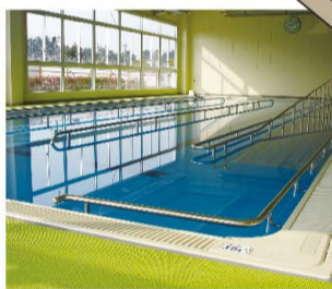
③歩行用プール (15m×3コース+スロープ) 屋内温水 様々な方にご利用して頂きやすい水深となっております。また、左右に手すりもついております。リハビリからシェイプアップ目的の方までどなたでも水中運動をお楽しみ頂けます。