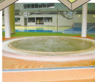
④ジャグジープール プールに入られた後は、ジャグジー・採暖室で暖まっていただけます。 ※ジャグジー・採暖室はプールご利用の方のみ使用していただけます