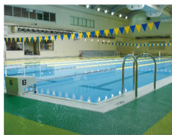
①競泳用プール (25m×6コース) 屋内温水 目的に応じて使用して頂ける全6コース。 ロングスイムコースやウォーキングコース など様々な目的に応じてご利用頂けます。