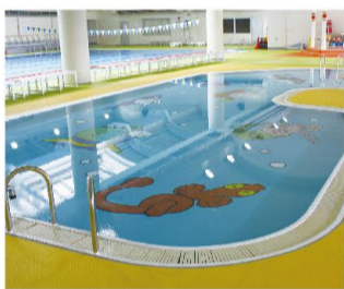
②幼児用プール 屋内温水 水深50cmで水慣れに最適です。 ※小さなお子様には保護者の方も、一緒にご利用下さい